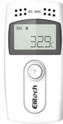
RC-4HC Temperature and Humidity Data Logger