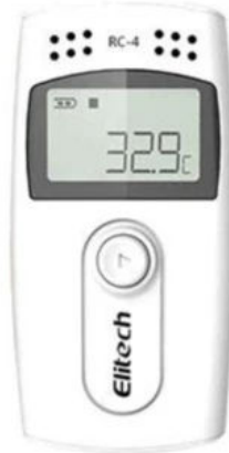
RC-4 Temperature Data Logger