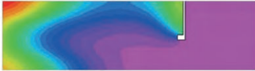
ANTES DE LA INSTALACIÓN